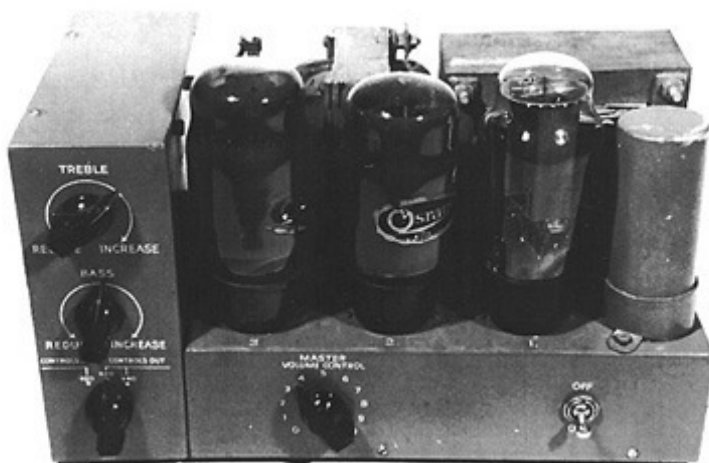
QA12P integrated mono valve amplifier (1948/51).

De fameuze audiofabrikant QUAD heette in 1951 The Acoustical Manufacturing Company, Ltd. Een mondvol, maar hun toenmalige versterkers droegen juist weer vrij cryptische namen als `QA12/P` (Quality Amplifier, 12 Watt, Preamplifier-stage, zie foto).